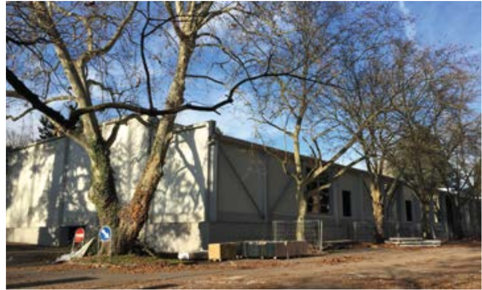
Temporary conference facility / Infrastructure temporaire pour les conférences

To ensure UN Geneva's ability to hold meetings and events throughout the SHP project, a temporary conference facility is being constructed within the compound of the Palais des Nations in P2 parking. The flexible space will first be divided into three rooms of 200 seats and will then be reconfigured into a large 600-seat conference room in 2022 until 2024 when it will be dismantled upon completion of the SHP project.